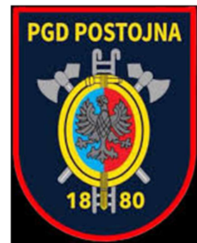
Slika 10: PGD