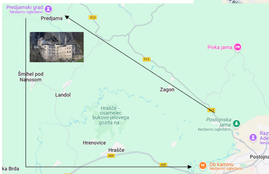
Slika 25, 26, 27: Pot na zemljevidu