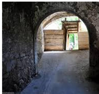
Slika 13, 14, 15: Mitnica