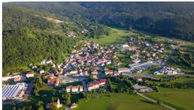
Slika 2: relief Senožeč danes