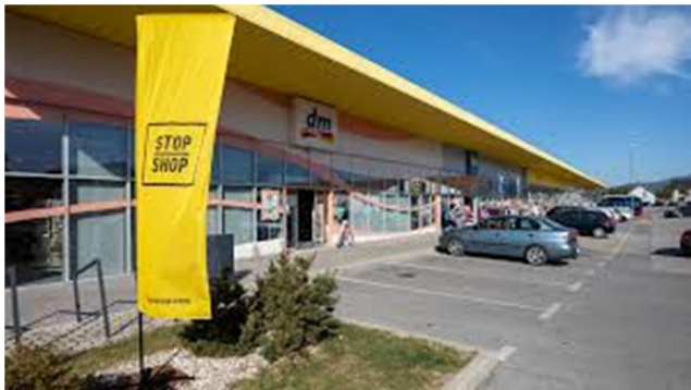
Slika 4: STOP-SHOP

V zadnjih letih je doživela razvoj na področju trgovine. Eden večjih trgovskih centrov je STOP-SHOP Postojna, ki ponuja raznoliko izbiro trgovin in storitev. V središču mesta se nahaja tudi poslovni center PTC Primorka Postojna s številnimi poslovalnicami. Za opravljanje vozniškega izpita sta na voljo tudi dve avtošoli, AMD in POLO.