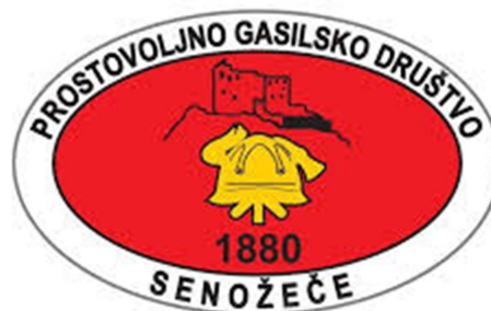
Slika 6: PGD Senožeče