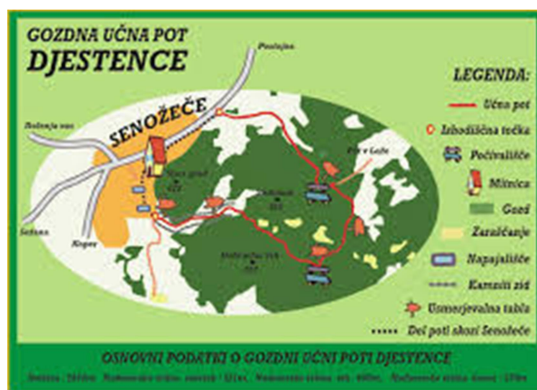
Slika 7: Djestence na zemljevidu