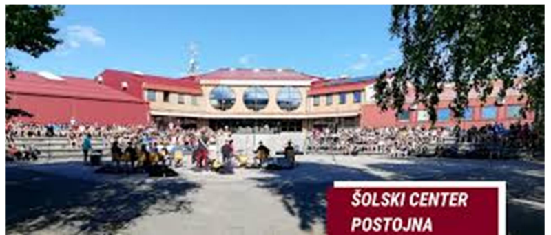
Slika 3: Šolski center Postojna