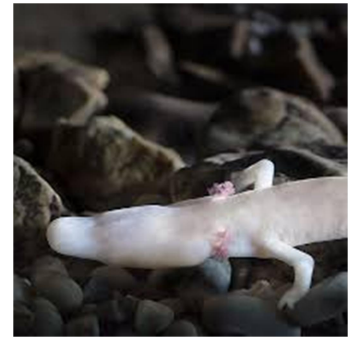
Slika 18, 19, 20: Razstava Vivarij Postojnska jama in Človeška ribica