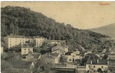
Slika 1: Senožeče 1916

V Senožečah je poskrbljeno za vse mlajše krajane, saj delujejo tako podružnica Osnovne šole dr. Bogomirja Magajne Divača kot tudi Vrtec Sežana z enoto v Senožečah. Prav tako Zdravstveni Dom Sežana zagotavlja zdravstveno oskrbo s svojo ambulanto v Senožečah. Aktivno pa delujeta tudi trgovina in bencinska črpalka.