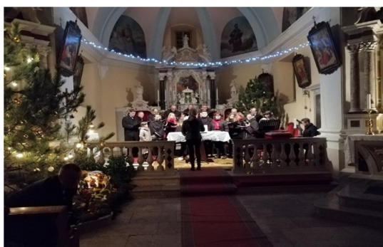
Slika 11, 12: Cerkev SV. Jerneja