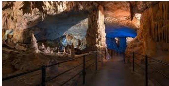
Slika 17: Park Postojnska jama