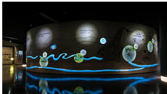
Slika 21, 22: EXPO Jama Kras