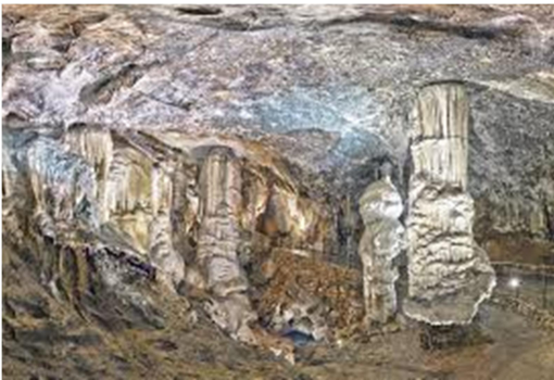
Slika 16: Postojnska jama

Ustvarila jo je ponikalnica, reka Pivka. Danes je jama zelo turistično aktivna namreč letno si jo ogleda več sto tisoč turistov iz vseh držav po svetu. Med znamenitostmi v jami je tudi »koncertna dvorana« z izjemno akustiko, ki sprejme do 10.000 ljudi in slavna človeška ribica, redka jamska žival, ki živi v njenih vodah.