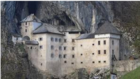
Slika 23, 24: Predjamski grad

Danes je grad turistična znamenitost, ravno zaradi svoje prepletene arhitekture med jamo in zidovjem in svoje lege po kateri je tudi dobil ime.