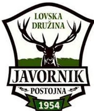
Slika 8: Lovska družina Javorniki Postojna

Poleg plesa Postojnčane navdušuje tudi glasba. Imajo tako glasbeno šolo kot tudi nekaj glasbenih društev, Glasbeno društvo Viola in Glasbeno društvo Lajna in prijatelji.