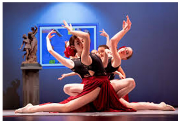
Slika 9: Baletno društvo Postojna