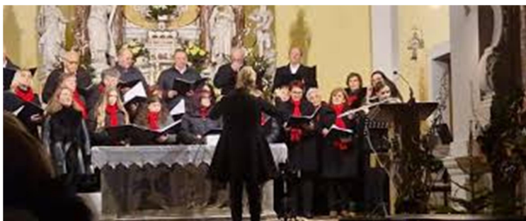
Slika 5: MEPZ Senožeče

Pravo tako se v bližini kraja razprostira 2850 metrov dolga gozdna učna pot Djestence. Pot namreč vodi od Razdrtega, skozi Senožeče na 1027 metrov visoko Vremščico.